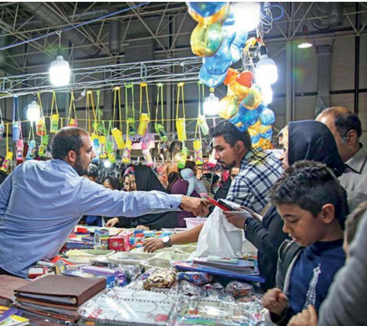
برداشتی کوتاه از نمایشگاه فروش پاییزه مشهد