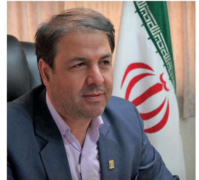
خزانه دار و عضو هیات رئیسه اتاق اصناف ایران:

نائب رئیس اتاق اصناف ایران با تبریک روز ملی اصناف گفت: اصناف ایام سختی را در دو سال اخیر همراه با دوره کرونا، تورم نرخ ارز و فشار مضاعف تحریم‌ها پشت سر گذاشتند و با وجود همه مشکلات همه جوره پای کار بودند و این نیز برگ زرین دیگری برای مجموعه صنفی کشور را اثبات کرد که نشان از مدیریت کارآمد و کابردی اصناف دارد. وی با بیان اینکه امسال نیز به نام تولید؛ دانش بنیان، اشتغال آفرین نامگذاری شده است که اصناف نیز در این مسیر پیشرو هستند و یقیناً به بهره‌وری نیز خواهند رسید. شکریه افزود: اصناف در راستای اجرای طرح اصلاح یارانه‌ها و قیمت‌ها در قیاس با دیگر مجموعه‌های اقتصادی در خط مقدم اجرای طرح بودند و همکاری موثری با دولت داشتند و امروز اصناف نیاز به معاضدت و همراهی دارند.