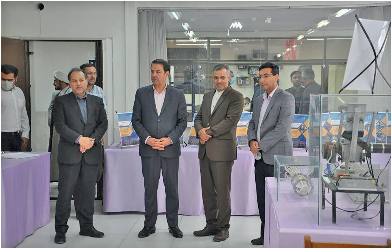
باحضور مسئولان صورت گرفت: