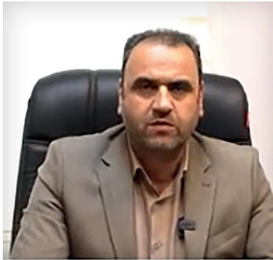
عضو هیات رئیسه اتاق اصناف ایران: