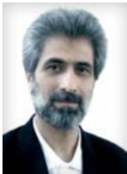
رئیس اتحادیه صنف تعمیرکاران و فروشندگان لاستیک مشهد

جنتی گفت: هر نوع افزایش قیمت لاستیک در این شرایط بازار به ضرر فروشندگان است زیرا دیگر متقاضی و خریداری برای این کالا وجود نخواهد داشت.