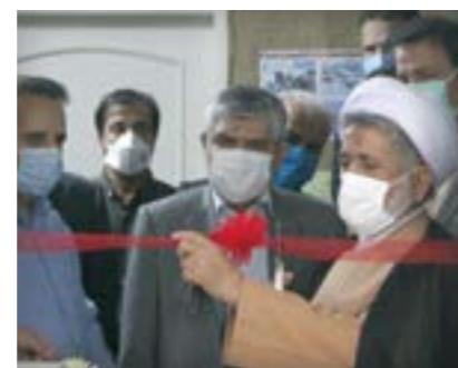
دفتر همیاران شوراهای حل اختلاف در اتاق اصناف مشهد افتتاح شد