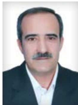
رئیس اتحادیه صنف تعمیرکاران و فروشندگان لاستیک مشهد