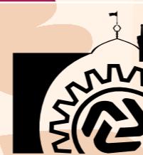
اتاق اصناف مشهد

● شورای رقابت فروش پسماند از طریق بورس کالا را تصویب کرد ۲۱