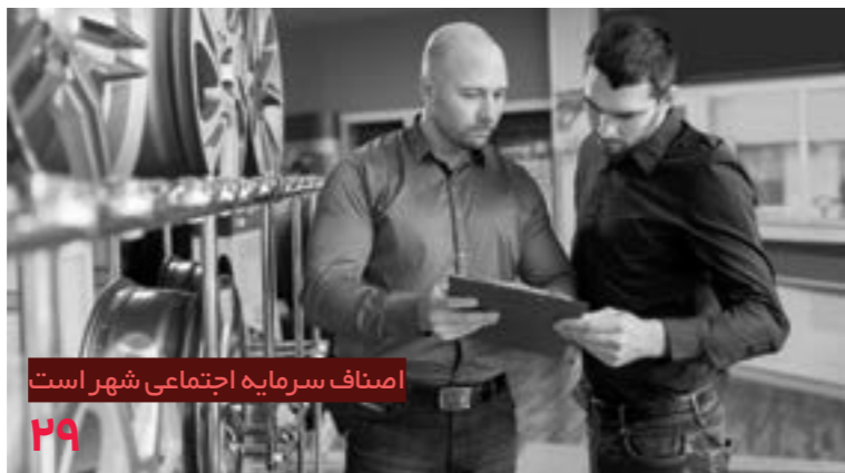
اصناف سرمایه اجتماعی شهر است ۲۹

منطق ملت ما، منطق مؤمنین، منطق قرآن است، انا لله و انا الیه راجعون. با این منطق هیچ قدرتی نمی‌تواند مقابله کند.