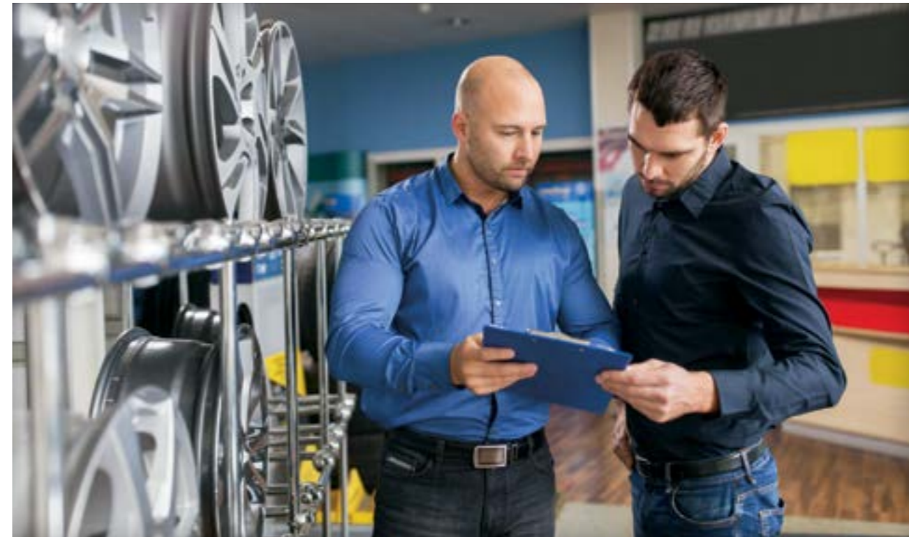
رئیس شورای اسلامی شهر مشهد: