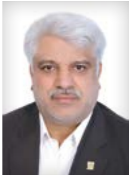
وعده‌هایی که تحقق نیافت

رئیس اتحادیه فروشندگان فرآورده‌های گوشتی، اغذیه، پیترز و غذاهای فانتزی بیان کرد: به خاطر شرایط به وجود آمده، حدودا ۵۰۰ واحد صنفی پروانه کسب خود را باطل کردند، چراکه نه تنها درآمدی نداشتند بلکه از پس هزینه‌ها و اجاره مغازه خود هم برنمی‌آمدند. حاصل ابطال این تعداد پروانه کسب، بیکاری افرادی زیادی در جامعه که خود معضلات زیادی را به همراه دارد، است.