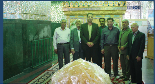
غبارروبی امامزاده یحیی به مناسبت دهه ی کرامت