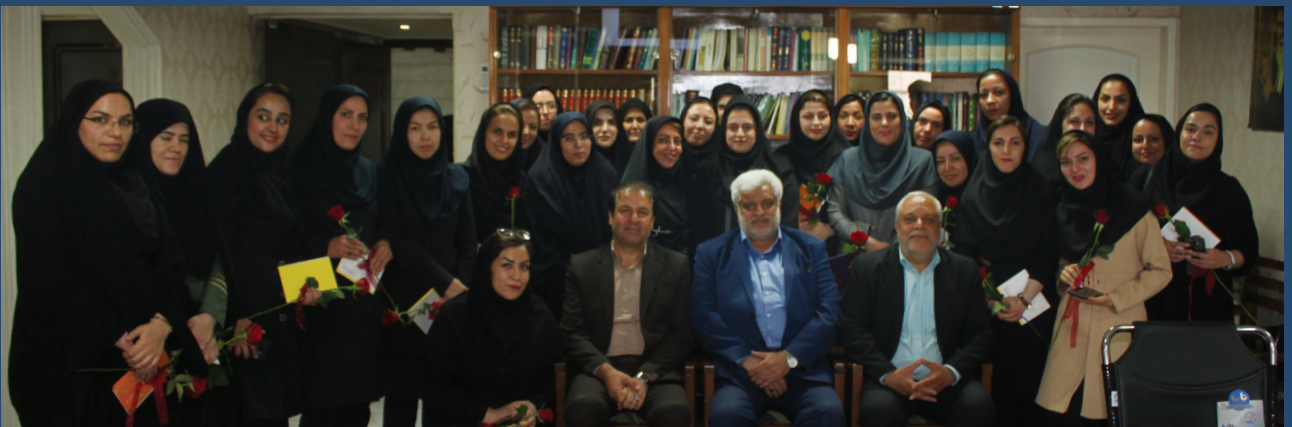
مراسم روز دختر به مناسبت ولادت حضرت معصومه (س) و روز دختر در اتاق اصناف مشهد