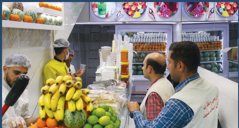
طرح بازرسی ویژه ی دهه ی کرامت