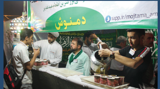
بزرگداشت دهه ی ولایت توسط اصناف مشهد در روز عید غدیر