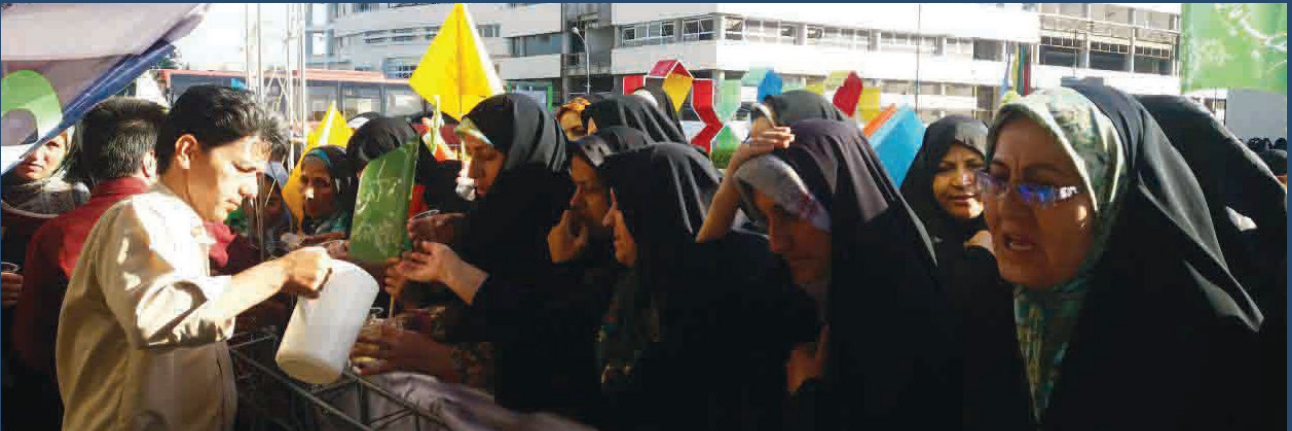
ایستگاه صلواتی توزیع گل و شربت در روز ولادت حضرت معصومه س به مناسبت دهه ی کرامت