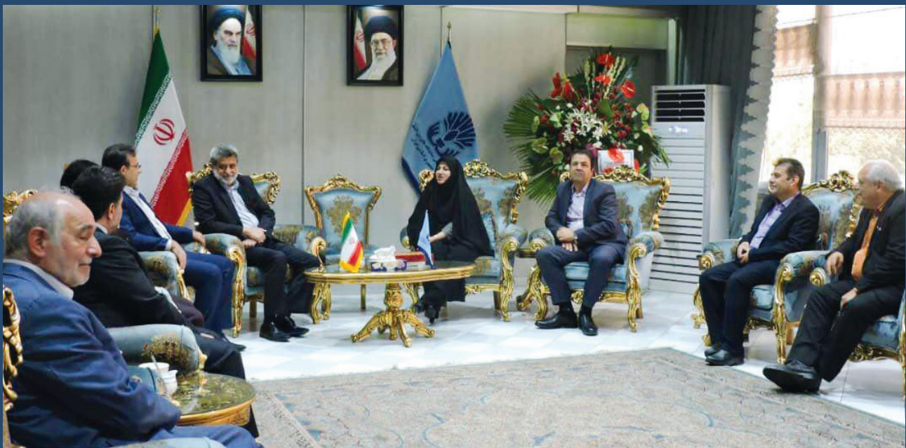
حضور سرکار خانم دست پاك رييس مركزملى فرش ايران در بازديد هيئت رئيسته اتاق اصناف ايران و رئيس اتحاديه صنف فرش دستباف مشهد از نمايشگاه فرش تهران